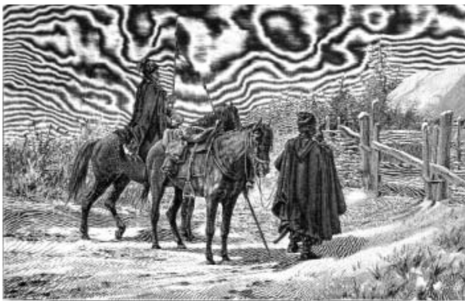
Пугу (условный крик запорожцев, открывший гостеприимные двери) Журнал «Нива», 1890 г.

Русское население не чувствовало никакой угрозы своим социальным правам и национальным интересам. В то же время численный состав и уклад жизни «украинских» русских, тесные культурные и исторические связи с Россией обусловили их стойкую самоидентификацию и стремление к объединению с исторической родиной. Эти же факторы определили позже уровень его противодействия украинскому национализму, продвигаемому властями. По существу, речь шла не о спонтанном проявлении русского национализма или сепаратизма, а о естественной общественно-политической реакции на уничтожение единого этнокультурного пространства в новом государственном образовании.