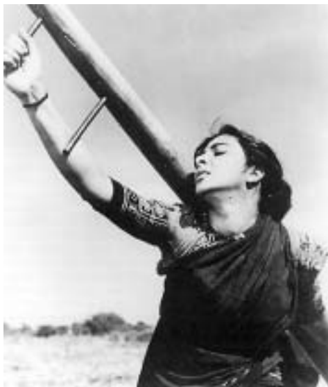
Кадр из классического фильма «Мать Индия», реж. Мехбуб Хан, Индия, 1957 г.

“Индия все больше замещает идею «автономии», столь дорогую сердцам традиционалистов, концепцией превращения в «ответственную державу». Дели считает, что позиция автономии подходит для слабых государств, пытающихся защитить себя от конкуренции с великими державами, но не для стран, которые, как Индия, находятся на стремительном подъеме”