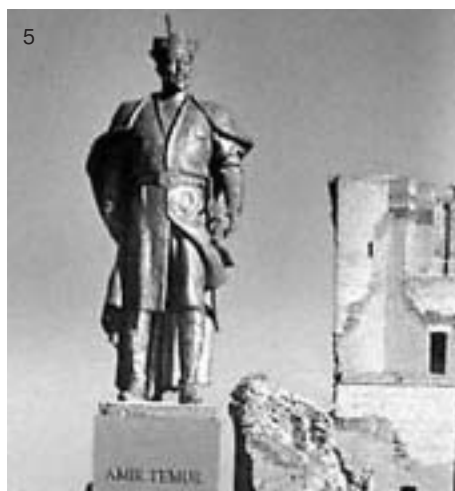
Монументальная пропаганда как отражение новой идентичности. (1) Статуя Туркменбаши (Ашхабад). (2) Бюст Степана Бандеры (Теребовль, Тернопольская область). (3) Памятная монета – белорусские партизаны. (4) Памятник героям национального эпоса (Алма-Ата). (5) Монумент Амира Тимура (Ташкент)