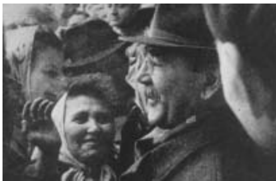
Будапешт, октябрь 1956 г. Премьер-министр Имре Надь с участниками массовых выступлений. Восставшие жгут советскую символику.

мнимых союзников: свидетельством тому — ввод войск в Восточную Германию в 1953-м и в Чехословакию в 1968 году. Но в некоторых случаях Кремль, пусть и неохотно, мирился с отклонениями от «генеральной линии». Так, Советы отказались от планов вторжения в Югославию, Польшу, Албанию и Румынию, несмотря на стойкое сопротивление жестким требованиям Москвы со стороны достаточно независимых коммунистических правительств этих стран.