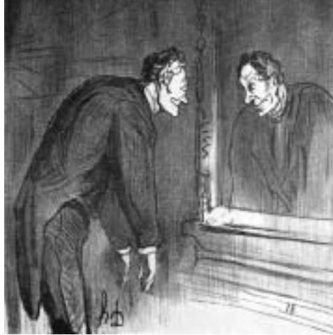
Кандидат в депутаты тренирует улыбку, с которой предстанет перед избирателем. Литография Оноре Домье, 1869 г.

“ - Вот вы, Иванов, например, к какой партии принадлежите?