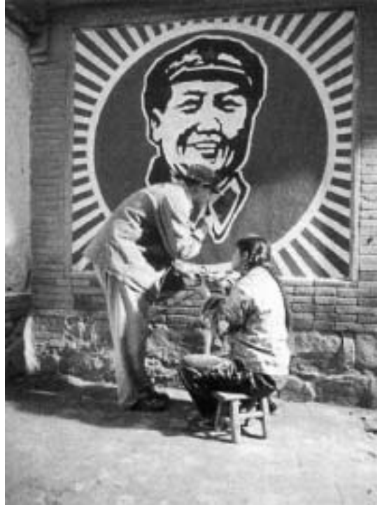
Кадр из фильма «Жить», реж. Чжан Имоу, КНР – Гонконг, 1994 г.

Партийно-государственное руководство страны во главе с Ху Цзиньтао, пришедшее к власти в 2002–2003 годах, одобрило публичное переосмысление «взгляда на развитие», предполагая лишь