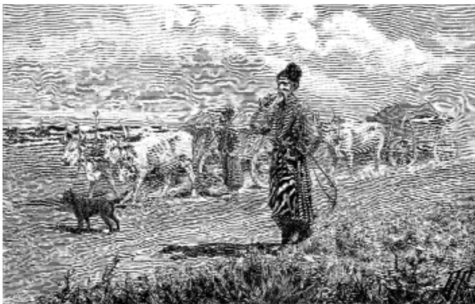
В Крым за солью. Журнал «Нива», 1890 г.

ферендум с формулировкой «Вы за воссоздание Крымской АССР как субъекта Союза ССР и участника Союзного договора?».