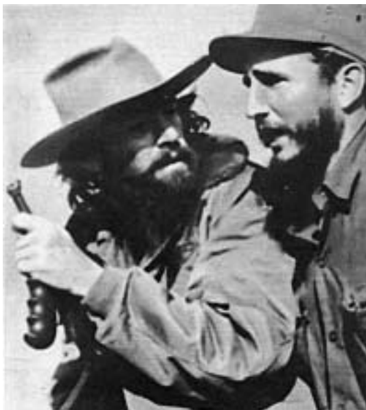
8 января 1959 года, Повстанческая армия вошла в Гавану. Фидель Кастро с майором Камило Сьенфуэгосом.

Скрепя сердце, Кастро заставил себя приоткрыть доступ частному предпринимательству, позволил эмигрантам направлять денежные переводы своим родственникам, разрешил свободное хождение в стране доллара, массовый туризм и так называемые совместные инвестиции. Последнее означало всего-навсего учреждение ассоциаций иностранных предпринимателей и кубинского правительства, которые открыто эксплуатировали невероятно дешевую рабочую силу, лишённую права создавать профсоюзы и протестовать. Кроме того, конфискации на таких предприятиях подвергалось около 95 % заработка. Арифметика применялась простая: иностранные инвесторы платили правительству Кубы за каждого трудящегося 400 долларов в месяц, а последнее выплачивало тому же работнику 400 пе-