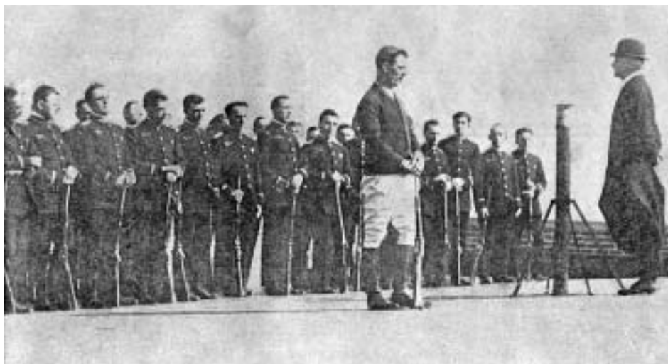
Вудро Вильсон вступил в войну с Германией! Добровольческая рота из служащих гостиницы «Бильтмор» в Нью-Йорке, 1917 г. Журнал «Новое время», 1917 г.

национальной стратегии Соединенных Штатов. После вторжения США в Ирак и провала попыток найти там оружие массового уничтожения (ОМУ) либо доказать наличие связи между Саддамом Хусейном и терактами 11 сентября две из трех основ политики Буша пошатнулись. Как следствие, Джордж Буш все больше внимания стал уделять той стороне его большой стратегии, которая касалась демократизации. В тексте Стратегии национальной безопасности-2006 слова «демократия» и «свобода» упоминаются более 200 раз (втрое чаще, чем в соответствующем документе-2002). Меньше говорится о превентивной войне, и даже содержится новая глава, посвященная глобализации (которую Буш однажды в частной беседе презрительно назвал «бесхребетным клинтонизмом»). Сдвиг произошел не только на словах: дипломатия в отношении Северной Кореи и Ирана носит сегодня куда более многосторонний характер, чем в период первого президентства.