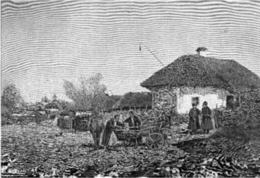
«У корчмы» (село Черкасская-Лозовая Харьковской губернии). Картина С. Васильковского. Выставка Императорской Академии художеств, 1890 г.

вать новые, это, конечно, не будет значить, что П. Струве научил или вдохновил г. Макарова, однако украинство должно учесть ту, несомненно, вновь для него обнаруживающуюся опасность, что в известной части идейной русской интеллигенции начинают распространяться идеи, лежавшие доселе в основании гонений против украинства.