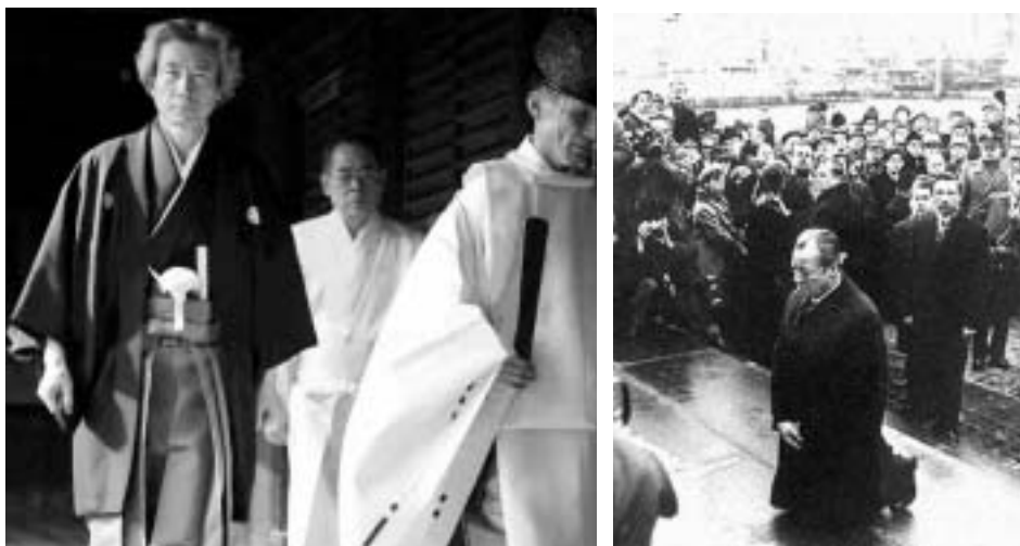
В отличие от экс-канцлера ФРГ Брандта (справа), премьер-министр Японии Коидзуми посещает исторические места, связанные со Второй мировой войной, не для того, чтобы каяться.

Высшие представители Японии, включая самого императора, неоднократно приносили извинения Китаю и другим государствам, пострадавшим от акций Токио. Однако эти шаги не заслужили полного доверия в восприятии китайского народа и его соседей, поскольку не отражали воли общества в целом и не являлись закономерным продуктом политической культуры Японии. Немалую негативную роль сыграли и демонстративные посещения японским премьер-министром Дзюньитиро Коидзуми храма Ясукуни, в котором похоронены люди, официально признанные военными преступниками.