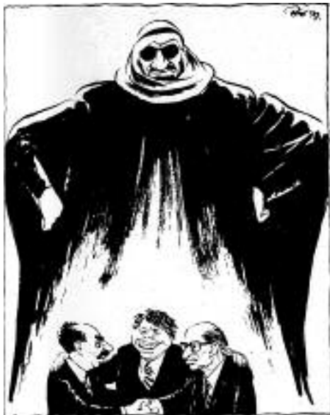
Президент Картер поздравляет президента Садата и премьера Бегина с заключением кемп-дэвидской сделки. Он советует вообще не замечать арабского народа Палестины. Х. Бидstrup, 1979 г.

“ Истинной причиной срыва всех мирных инициатив и усилий посредников является неспособность международного сообщества (кроме как на словах) отвергнуть и осудить идею Израиля, будто оккупация и создание поселений на захваченных им землях могут продолжаться неопределенное время, пока не будет подписан мирный договор ”