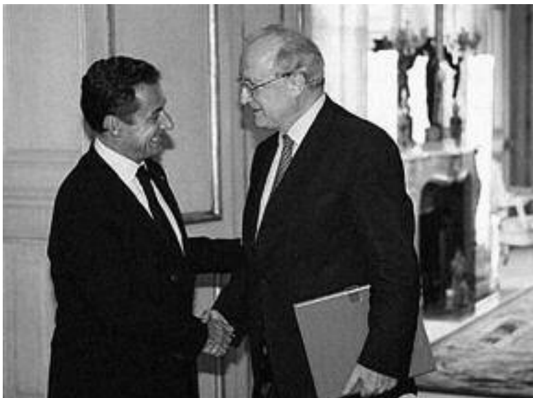
Юбер Ведрин (справа) и президент Франции Николя Саркози

“ Вопрос о протекционизме не может рассматриваться только в теоретическом плане. У нас нет выбора между полной открытостью и протекционизмом или между полным универсализмом и национальной идентичностью. Необходимо найти баланс между двумя полюсами, который позволит мировой экономике эффективно функционировать, но одновременно даст возможность каждой отдельной стране защищать свои фундаментальные интересы ”