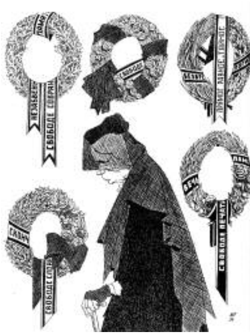
Кладбище буржуазных свобод. Журнал «Крокодил», 1936 г.

“ Если нейтральный наблюдатель, прилетевший, к примеру, с Марса, прочтет газетные заголовки последних месяцев, у него сложится впечатление, что Россия находится в состоянии ожесточенного и длительного противоборства с Западом. Но если он же побывает на одной из десятков встреч по развитию разнообразного практического сотрудничества, он придет к противоположному выводу ”