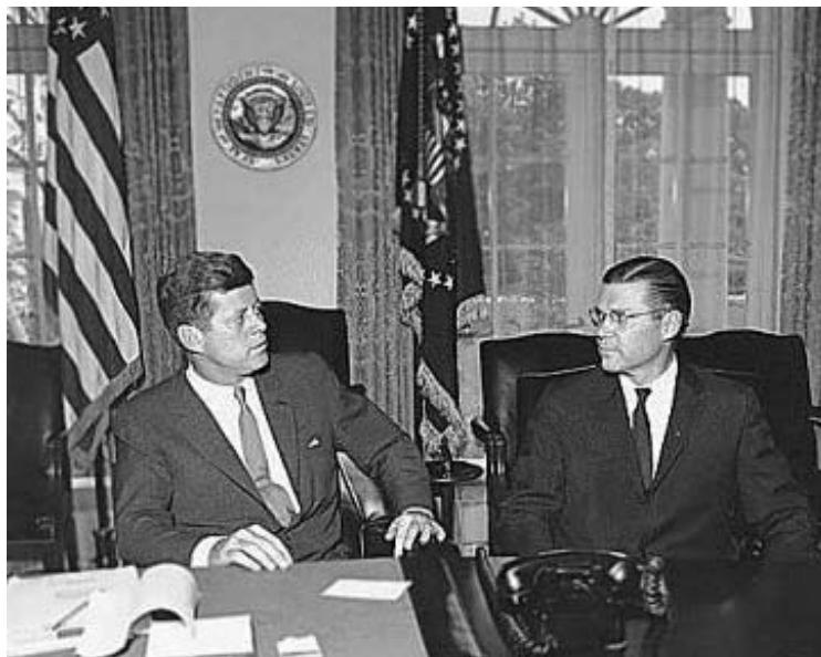
Президент Джон Кеннеди и министр обороны Роберт Макнамара

“ Министерство обороны и Вооруженные силы традиционно рассматриваются в России как единое целое. От подобной традиции давно уже следовало отказаться, но реальная возможность для этого появилась только сейчас. Новому гражданскому министру придется создавать принципиально новое ведомство, ключевые посты в котором должны занимать лица гражданские ”