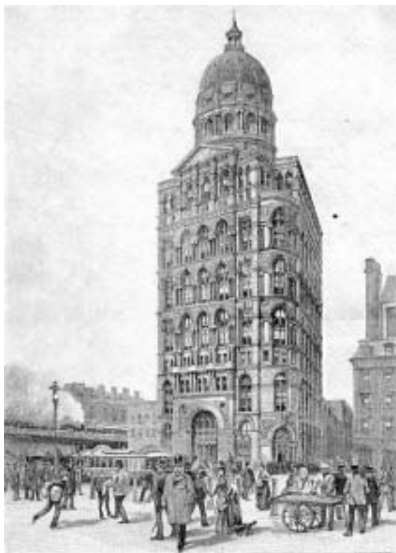
Американский «Дворец прессы», «Нива», 1890 г.

Другая опасность исходит от неопределенности нынешней международной ситуации. Глобализация значительно облегчила распространение идей, в том числе порождающих нетерпимость и насилие, стимулировала контрабанду оружия и наркотиков. Миллионы людей ежедневно бесконтрольно пересекают границы, новые технологии появляются чуть ли не каждый день. В результате наши государства во многих отношениях потеряли контроль над ситуацией, что отразилось на планировании внешней политики.