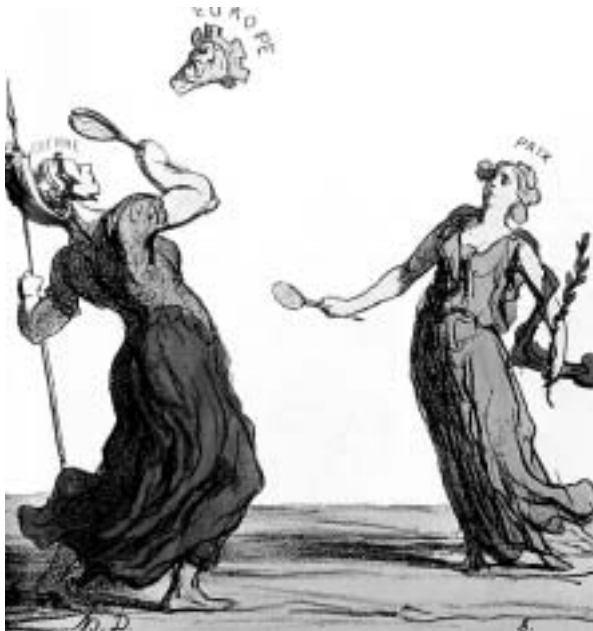
Оноре Домье, «Игра в бадминтон», 1869 г.

“ Сокращение исторически стабилизирующей роли Соединенных Штатов создает в Европе вакуум силы, заполнить который европейские государства, действующие в рамках своих «вестфальских» суверенитетов, пока не могут. Перестав играть в Старом Свете роль стабилизирующего фактора, Вашингтон вольно или невольно начинает выступать в достаточно деструктивном качестве ”