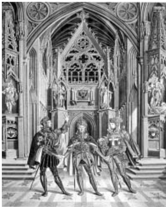
Генрих Оливье, Священный альянс: прусский и австрийский императоры вместе с русским царем Александром I, 1815 г.

В-третьих , налицо низкая управляемость на уровне сообщества. Причина – в неспособности на данный момент осуществить устра-