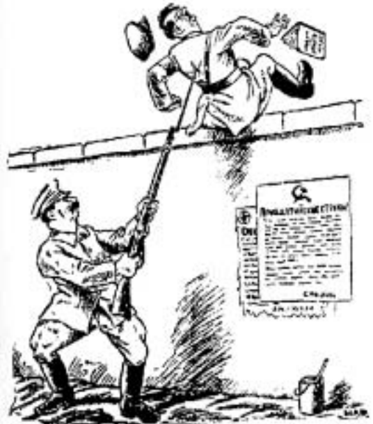
Советско-германский пакт – Обопрись хорошенько, я тебя поддержу. Рис. Mad'a, Париж, 1939 г.