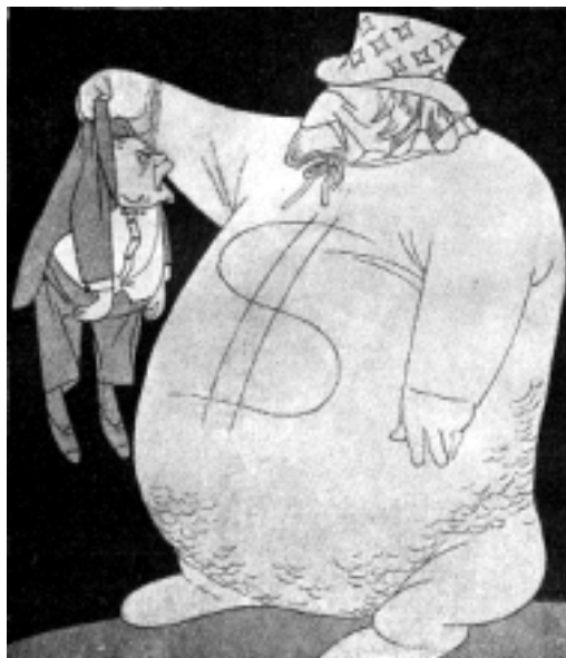
Пуанкаре (принимая развязный тон): Когда же ты проснешься, Америка? Карикатура из журнала Simplicissimus (Германия), 1923 г.

“ Америка под руководством Джорджа Буша ненасытна в коллекционировании врагов. На традицию государственного мессианства накладывается мессианство лидера, убежденного в том, что он исполняет волю Бога. Чем крупнее и злее враг, чем «глобальнее» война, тем больше растут в глазах Америки как ценность ее идеалов, так и необходимость их защиты ”