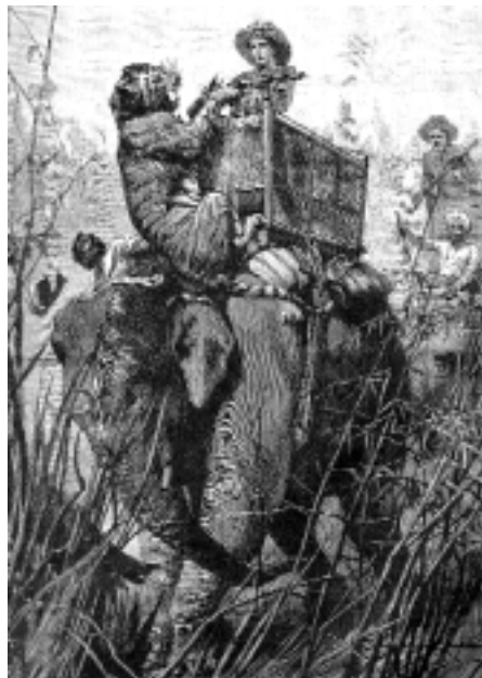
Приключение герцога Орлеанского на охоте за тигром в Индии. Литография из журнала «Нива», 1899 г.

“ На рынке идей мироустройства, адекватного современному этапу мирового развития, впервые за долгие годы возникает реальная конкурентная среда. Становление новых глобальных центров влияния и роста, более равномерное распределение ресурсов развития и контроля за природными богатствами закладывают материальную основу для многополярного миропорядка ”