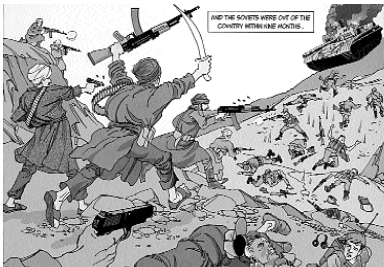
Афганские моджахеды изгоняют советских оккупантов из Афганистана. Иллюстрация из «Доклада Комиссии 9/11», графическая адаптация», Нью-Йорк, 2006 г.

“ Российские политики любят напоминать, что, в отличие от Запада, Россия относится к исламскому миру с большим пониманием, «прощая» ему излишнюю нервозность. Всякий раз, когда в Европе или в США возникают связанные с исламом скандалы, из Москвы раздаются почти менторские призывы к умеренности и осторожности ”