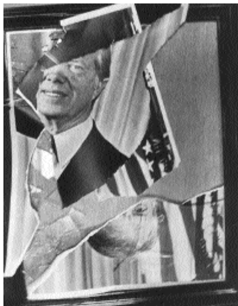
Портрет президента США Джимми Картера, разорванный иранскими демонстрантами, 1979 г.

Хоссейни-Таш, «ядерная программа дает нам шанс предпринять попытку занять стратегическую позицию и консолидировать национальное самосознание». Но умеренные верят также и в необходимость умеренной политики. Они выступают за последовательное соблюдение обязательств по Договору о нераспространении ядерного оружия (ДНЯО) и подчеркивают важность мер, направленных на повышение доверия к Ирану со стороны мирового сообщества. Умеренные надеются, что, улучшив отношения Тегерана с Вашингтоном, они смогут смягчить опасения Соединенных Штатов по поводу иранской ядерной программы и избежать необходимости отказываться от нее.