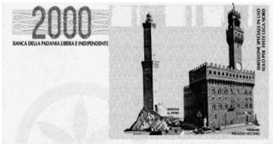
Деньги несуществующей «Паданской республики»

редаче регионам основных функций законодательной власти, в развитии местного самоуправления, лишившего центральные власти важных государственных рычагов. Однако две трети участников референдума отвергли новацию, нанеся удар по «ползучему сепаратизму». Хотя и здесь еще рано ставить точку.