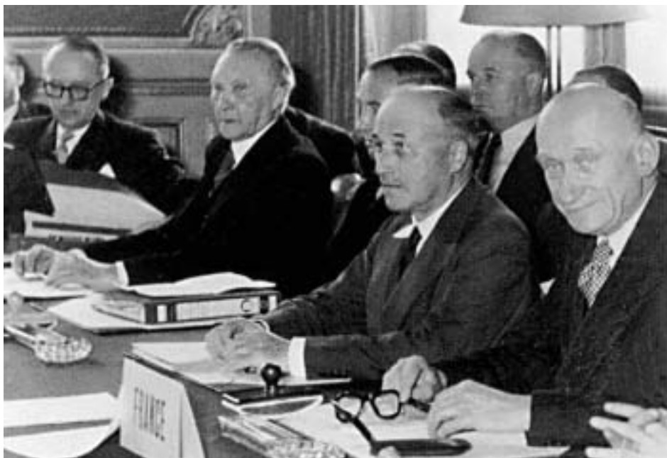
«Отцы» интеграции – Вальтер Хальштайн, Конрад Аденауэр, Жан Монн е, Робер Шуман

него рынка (1985–1992) и создания ЭВС (1992–1999), – публично заявил, что ЕС переживает самый тяжелый кризис в своей истории, потерял ориентацию и не имеет общего видения единой Европы.