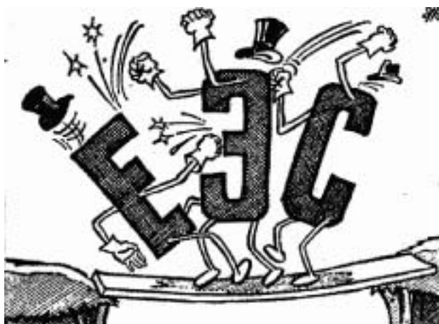
Переговоры в «Общем рынке», 1980-е гг.

— История сотрудничества ЕС с Россией мне хорошо известна. На этапе подготовки договоров с Москвой я возглавлял Европейскую комиссию и у меня было множество контактов с Михаилом Горбачёвым, а потом и с Борисом Ельциным. Это были впечатляющие времена — прежде всего потому, что при всем огромном масштабе событий 1985–1994 годов удалось избежать трагедий, что не так часто случается в истории. Тот период продемонстрировал, что мы можем доверять человечеству, — ведь бывали моменты, когда очень серьезные трения между государствами устранялись бла-