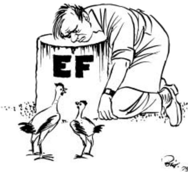
Дания жертвует суверенитетом в пользу ЕЭС. Херлуф Бидstrup, 1975 г.

— Лично я вижу только три глобальные цели. Первая состоит в том, чтобы всячески поддерживать мир и согласие между народами. Вторая — сделать все возможное для развития взаимной европейской солидарности, которая должна помочь выровнять уровни раз-