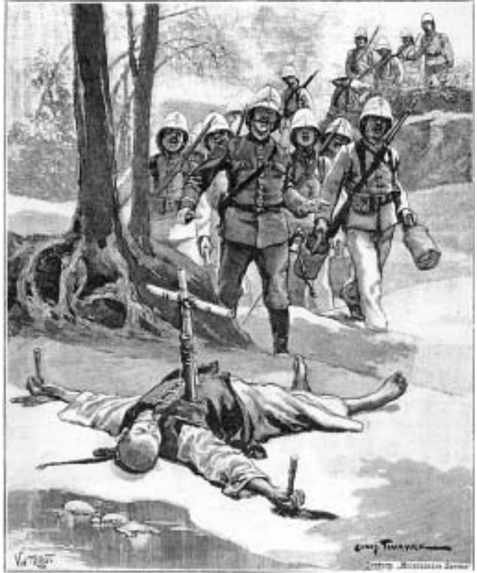
Замученный боксерами китаец-христианин «Московский листок», 1900 г.

Авторитетом новую «мультицивилизационную» парадигму наделили основополагающие работы Тойнби «Постижение истории» и Броделя «История цивилизаций», а популярной в широких элитных массах, особенно в России, сделало ее «Столкновение цивилизаций» Хантингтона.