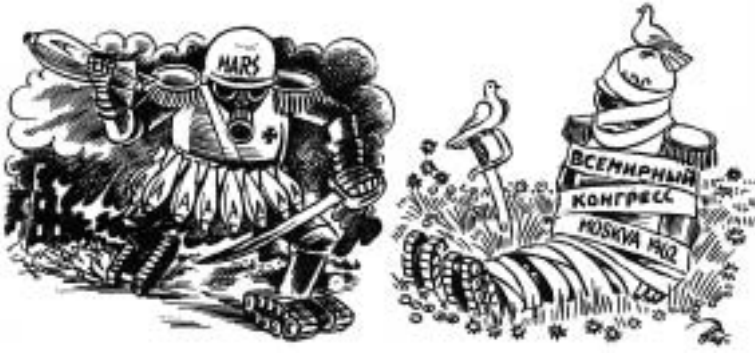
Рис. Херлуфа Бидструпа

“ Потеряло свою актуальность само противопоставление: или холодная война — или единство интересов и интеграция. Россия нащупывает сегодня новые формы взаимоотношений с Западом — явно конфликтные и основанные на довольно жесткой борьбе, но имеющие мало общего с минувшей холодной войной ”