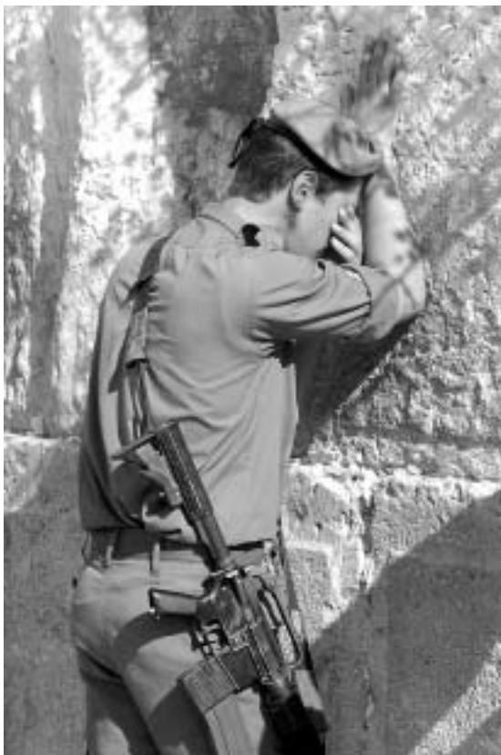
Израильская армия укрепит боеспособность НАТО

Так что изолировать Израиль от западного мира было бы непростительной ошибкой – такой же, как решение вывести испанские войска из Ирака. Тогда террористы одержали своего рода победу. Пойдя у них на поводу, мы подали им сигнал, чреватый самыми печальными последствиями. Кроме того, я придерживаюсь принципа верности союзникам. Представьте себе, например, что после высадки союзнических сил в Нормандии во время Второй мировой