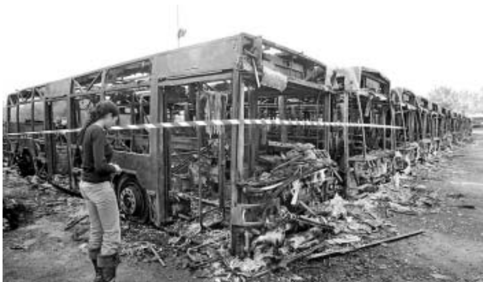
Предместья Парижа: трудный поиск идентичности. Ноябрь 2005 г.

весьма проблематичным. В рамках же стабилизационного варианта (сохранение численности населения России на нынешнем уровне) доля иммигрантов и их потомков к концу века может составлять до 50 %.