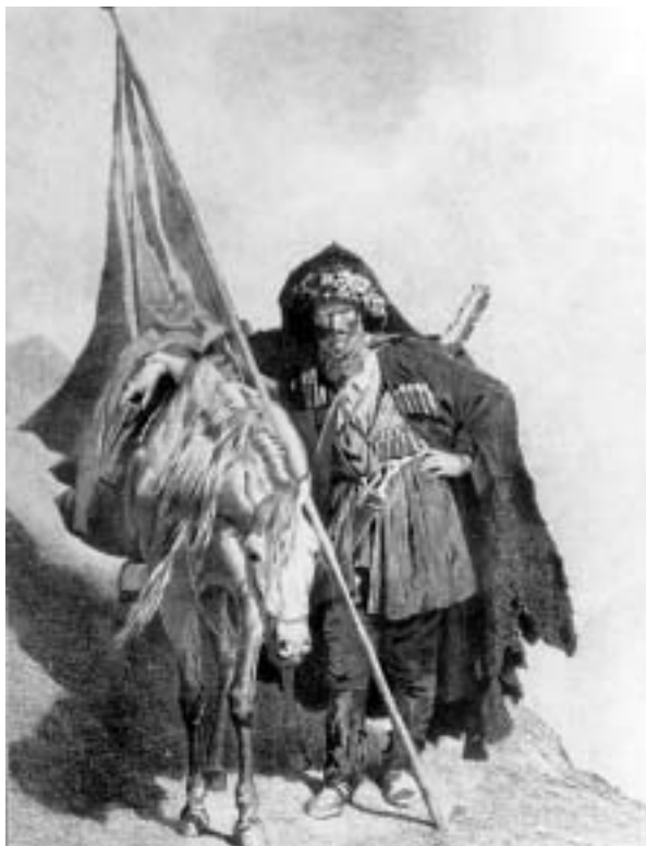
Мюрид с наибским знаменем Офорт Л.Е. Дмитриева-Кавказского по рисунку Ф.Ф. Горшельта. 1874 г.

«Внутренняя» ксенофобия неотделима от «внешней». Но, к примеру, антиамериканизм принципиально отличается от исламофобии. Американцев не боятся, их бытовым стереотипам пытаются подражать, им завидуют. Это — своего рода национальный комплекс неполноценности, которую бывшая сверхдержава испытывает по отношению к стране, сумевшей сохранить великодержавный статус.