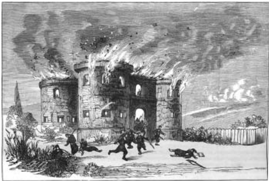
Взятие сербами турецкой крепости. «Газета А. Гатцука», 1876 г.

верховенства закона, так и фундаментальных, незыблемых моральных ценностей.