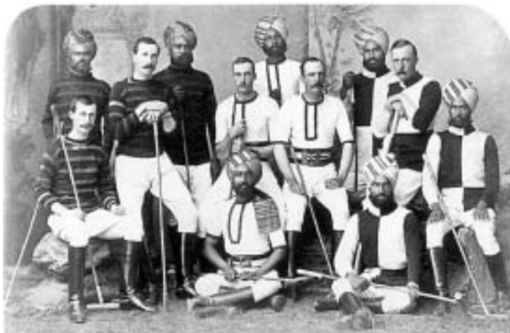
Команда по поло британского воинского контингента в Хайдерабаде. Британская Индия, начало XX века

“ Самым верным средством обеспечения экономического, социального и культурного роста в нынешнем столетии окажется опора на ценности свободы, ответственности и справедливости. Если мы хотим добиться успеха, необходимо возвратиться к истории и вновь отыскать в ней, возродить и применить с учётом требований нашего времени те общие ценности, которые объединяют нас и ставят общую цель ”