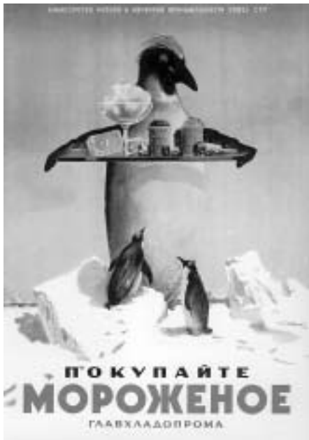
Советская потребительская реклама и наглядная агитация 1930–1940-х гг.