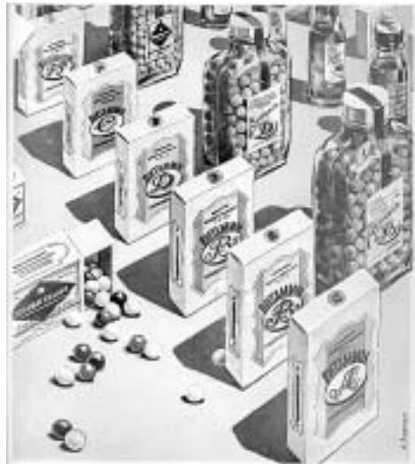
ДЛЯ СОХРАНЕНИЯ ЗДОРОВЬЯ РЕГУЛЯРНО ПОЛЬЗУЙТЕСЬ ВИТАМИНАМИ И ПОЛИВИТАМИНАМИ