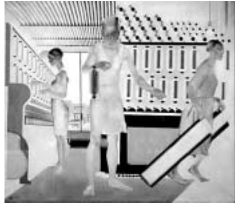
Министерство Восточной Промышленности РСФСР Трест «Индустрия».