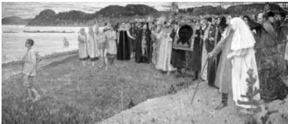
Михаил Нестеров. Святая Русь

лософ и правовед, — не есть неизбежно ненависть к другим народам; самоутверждение не есть непременно нападение; отстаивание своего совсем не означает завоевания чужого. И таким образом национализм и патриотизм становятся явлениями высокого духа, а не порывами заносчивости, самомнения и кровопролитного варварства, как пытаются изобразить это иные современные публицисты, не помнящие родства и растерявшие национальный дух».