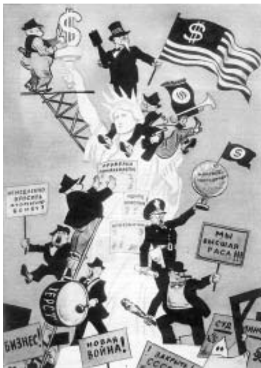
Рис. Бориса Ефимова. «Огонек», 1948 г.

“ НАТО меняется, но, возможно, этих изменений недостаточно. Если главная цель альянса отныне не территориальная оборона, а объединение стран с общими ценностями и интересами во имя решения глобальных проблем, ему нет необходимости оставаться строго трансатлантическим ”