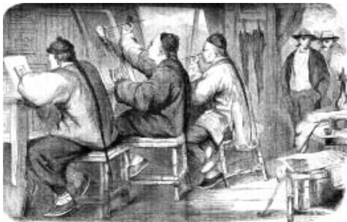
Китайские живописцы. Журнал «Воскресный досуг», 1865 год

“ Осознание того, что Азия не является ни началом, ни концом линейной мировой истории, не обособляется от остального мира и не подчиняется ему, даёт возможность иначе понять всемирную историю. Нельзя продолжать оценивать Азию с той же точки зрения, с какой Европа рассматривает саму себя ”