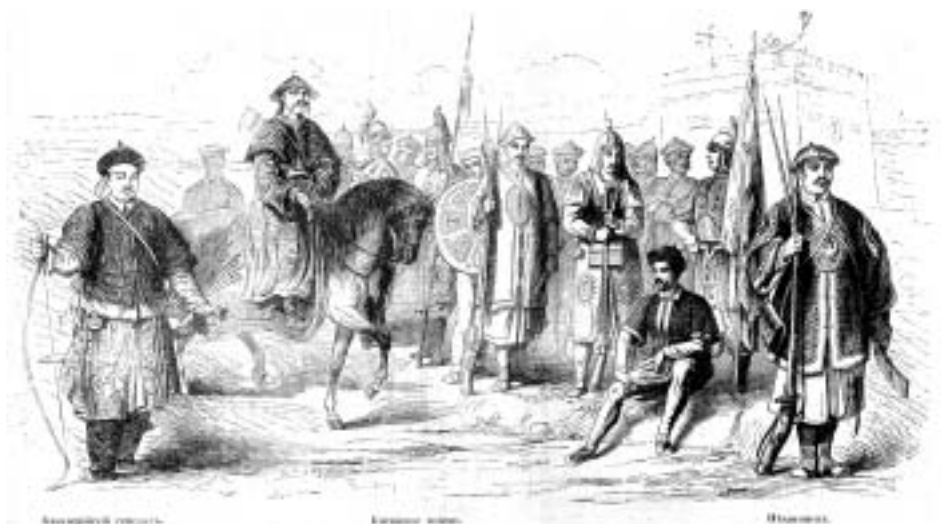
Живописный сборник замечательных предметов из наук, искусств, промышленности и общежития, 1858 год

тельной способности ВВП. Один только объем ценных бумаг США, имеющих в распоряжении КНР, дает стране серьезные возможности воздействия на Соединенные Штаты и мировую финансовую систему. Многие, правда, предсказывают, что слишком быстрые реформы приведут Пекин к неизбежному кризису, но такие пророчества звучат уже два десятилетия.