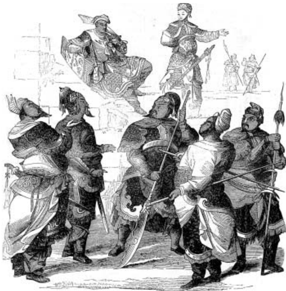
Китайские офицеры Живописный сборник замечательных предметов из наук, искусств, промышленности и общежития, 1858 год

ларов, или около половины всех военных затрат в мире. Причем доля бюджета, выраженная в процентах от ВВП, оказалась даже меньше, чем в годы холодной войны.