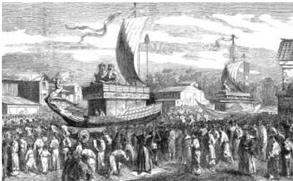
Кортеж гениев-покровителей Японии. Живописный сборник замечательных предметов из наук, искусств, промышленности и общежития, 1858 год

агентство утверждало, что «если объединение Азии ускорится, то [...] в ходе этого процесса Япония и Китай естественным образом перестанут ощущать дистанцию между собой. Встреча руководителей АСЕАН, Японии, Китая и Южной Кореи, которая стала бы первыми региональными переговорами без участия США, могла бы привести к азиатской версии примирения Франции и Германии».