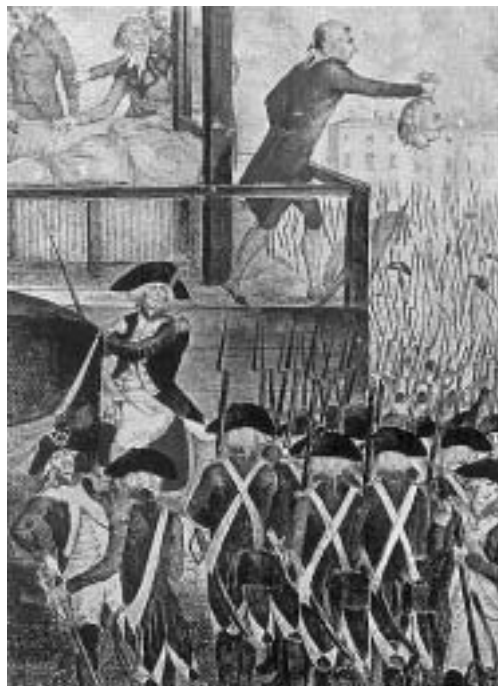
Казнь короля Людовика XVI

“ Мы, ворчуны из секты недовольных и испуганных, против новых моральных революций и натягивания вожжей, против специальных комиссий для выслеживания врагов добродетели или Божьего порядка, мы против очередных проскрипционных списков. Нам, брюзгам, пре- тят новые революции в стране, еще не пришедшей в себя после нескольких предыдущих... ”