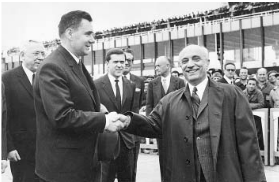
У истоков общеевропейского процесса. Министр иностранных дел СССР Андрей Громыко и его итальянский коллега Аминторе Фанфани. Рим, 1966 год.

ального раздела Follow Up to the Conference — договоренности о дальнейшем развитии процесса.