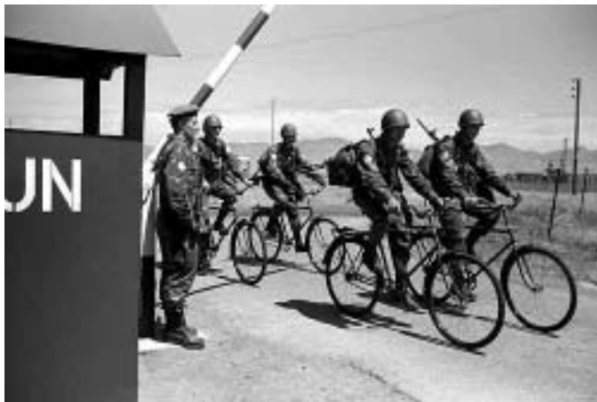
Финские миротворцы из контингента ООН на Кипре, 1964 год

“ Будущие поколения не простят нам, если мы продолжим двигаться по нынешнему пути. Мы не можем действовать вразнобой и обходиться незначительными ответными мерами... Миру необходимо срочно объединиться, чтобы управлять сегодняшними угрозами и не позволить им разделить и тем самым одолеть нас ”