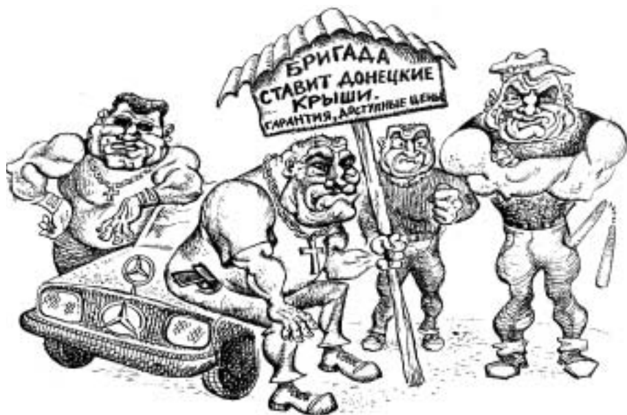
Образец предвыборного творчества сторонников Виктора Ющенко

западных стран, в которых их «призывали» принять «единственно верное решение» и намекали на возможность «персональных санкций» (например, запрет на выдачу виз).