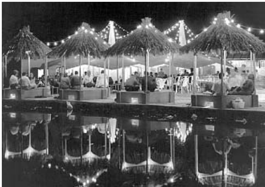
Остров Киш – иранский Куршевель для новых богатых

да, и революционная трехдневная щетина. Большинство молодых мужчин чисто выбриты или носят аккуратные испанские бородки.