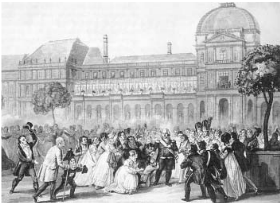
Парижане восторженно встречают Реставрацию: возвращение Людовика XVIII 8 июля 1815 года после поражения Наполеона при Ватерлоо

ва Мари Жозефа де Лафайета о том, что народ становится свободным, как только сам того пожелает. Революционеры же повторяли: революция победила почти бескровно и открыла ворота, через которые Франция устремилась от тирании к свободе.