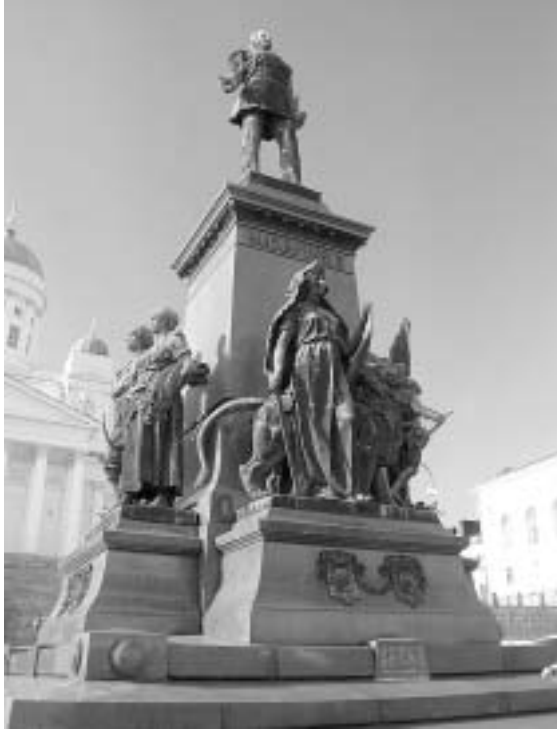
Памятник российскому императору Александру II на Сенатской площади в Хельсинки

“ Мы плохо знаем родную историю. Мы ориентируемся на историческую мифологию, сочиненную большевиками и враждебными им традиционалистами. А реальный исторический опыт России куда объемнее. И либеральные ценности выстраданы ею в полной мере. Самостоятельно ”