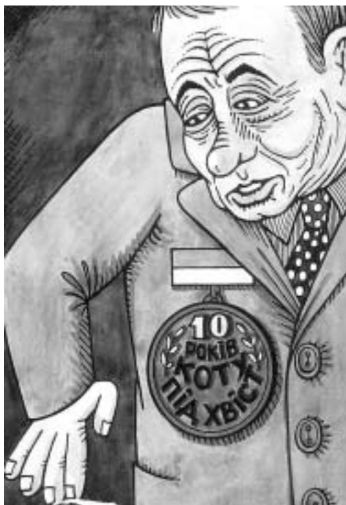
Леонид Кучма – кавалер почетной медали «10 лет коту под хвост»

будущее, веря, что даже коррумпированное украинское государство, просуществовав какое-то время, сможет создать собственную нацию. Богатые приспособятся к его законам и захотят завязать отношения с государственными чиновниками. Люди, не связанные с украинской культурой, смогут почувствовать себя гражданами украинского государства, если будут представлены в его институтах. В 1990-е годы эти идеи подверглись испытанию практикой. Проворные предприниматели завладевали бывшими государственными активами, создавали и эксплуатировали монополии, осуществляли прибыльные капиталовложения. На самом востоке Украины, рядом с российской границей, сын шахтера Ринат Ахметов, начав с угля и стали, ско-