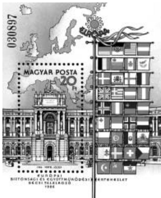
Венгерский почтовый блок, посвященный Венской встрече представителей государств – участников СБСЕ, 1986 год

“ «Дети XX съезда» считали, что продвижение в сторону соблюдения прав человека — не уступка Западу, а необходимый залог развития страны; что демократические преобразования давным-давно назрели и что если их подтолкнет внешняя политика, то честь ей за это и хвала ”