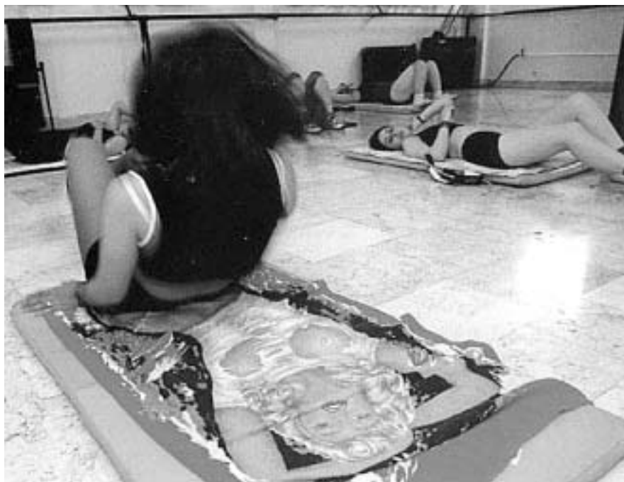
Фитнес покорил иранских женщин

Изменились и мужчины. Прежде они были обязаны носить рубашки с длинными рукавами и забыть о галстуках. Ныне в ходу спортивные открытые майки, а зачастую и сорочки с галстуками, которые свободно продаются в тегеранских магазинах. Вышли из моды и окладистая боро-