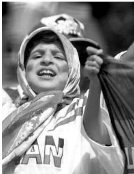
Иран: четверть века после исламской революции

“ В умах молодого поколения иранцев идет постоянная борьба между традиционализмом и глобализмом. В результате чего их политические воззрения меняются с периодичностью смены дня и ночи. Это, кстати, относится не только к молодежи, но и в целом к интеллектуальной части иранского общества ”