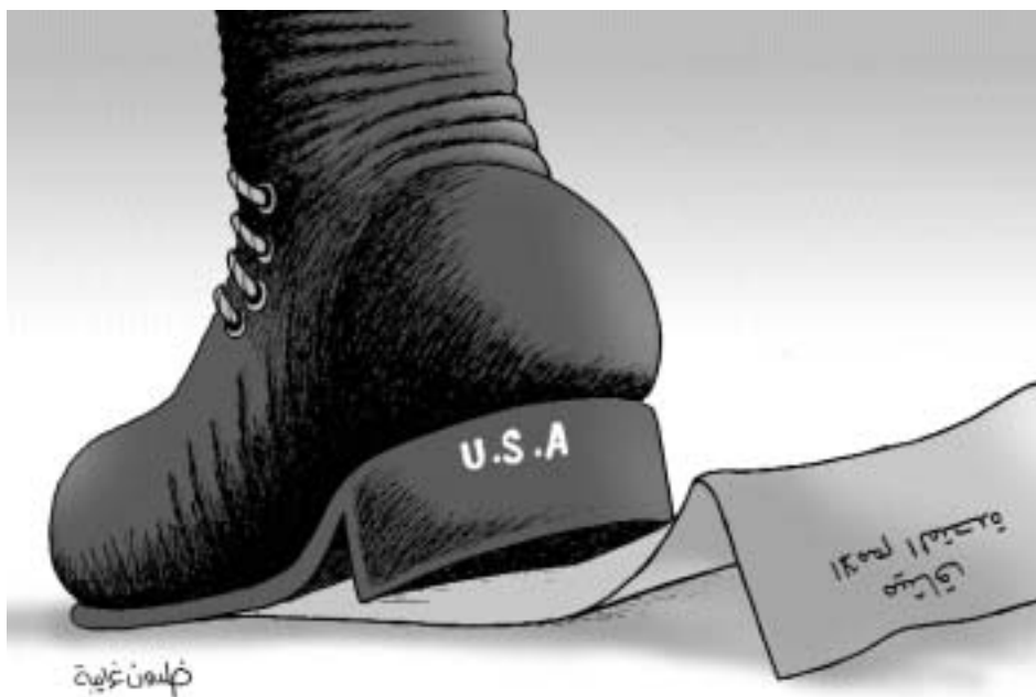
Соединенные Штаты и Устав ООН. Карикатура из арабской прессы

говора о создании Международного уголовного суда и отказ Вашингтона от ратификации Киотского протокола.