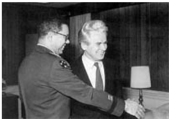
Посол Дубинин (справа) и генерал Пауэлл

енные бюджеты. Правда, в самой администрации явно наметились разногласия. «Ястребы» из Пентагона под руководством решительного и воинственного министра обороны считают, что Вашингтону нет нужды заботиться о мнении