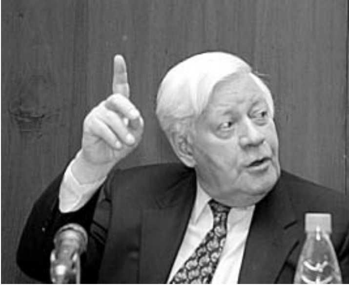
Гельмут Шмидт выступает перед читателями журнала «Россия в глобальной политике». Москва, июнь 2003 года

“ В развивающемся мире выигрывают главным образом те страны, где у власти находятся просвещенные в экономическом отношении, но авторитарные правительства. Я полагаю — хотя и не вполне уверен, — что Россия также окажется в этом ряду государств ”