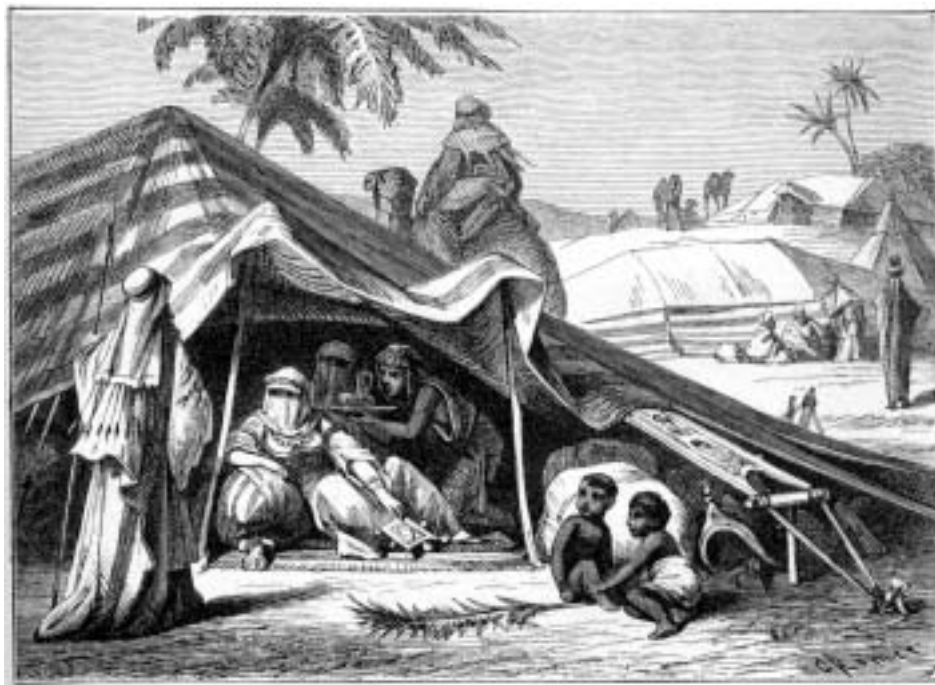
Арабский шатер. E.v. Seydlitz. Grosses Lehrbuch der Geographie, Breslau, 1905