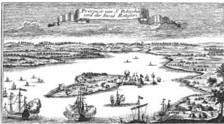
Видъ мѣстности С.-Петербурга. Съ гора Бабьихъ.

Князь М.М. Щербатов. «О повреждении нравов в России»