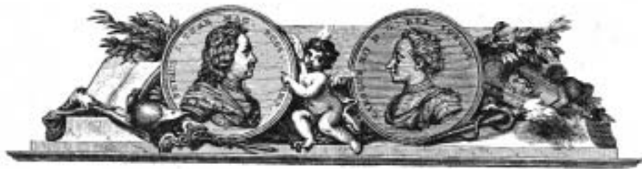
Петр I и Карл XII.

шого песчаного островка, на котором позднее была построена Петропавловская крепость.